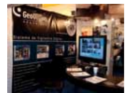
68. Provisión Digital