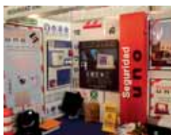
20. Seguridad Uno