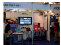
60. Cámaras Over Net