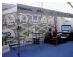
15-16. Wireless Solution