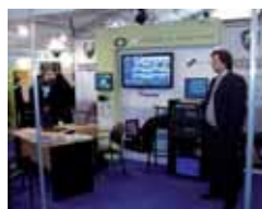
55-65. Federal Resguard