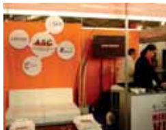
31-41. ASC Group