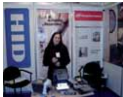
34. Punto Control