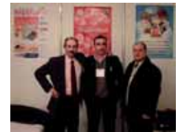
47. Negocios de Seguridad