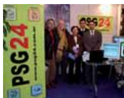
22. PSG 24