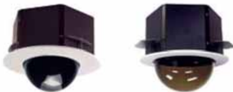
Ejemplos de carcasas para cámaras de red fijas montadas a ras del techo.

También es importante el modo en el que están montadas las cámaras y las carcasas. Una cámara de red fija convencional y un domo PTZ montadas en la superficie del techo son más vulnerables a ataques que un domo o domo PTZ montados a ras del techo o pared, donde sólo se ve la parte transparente de la cámara.